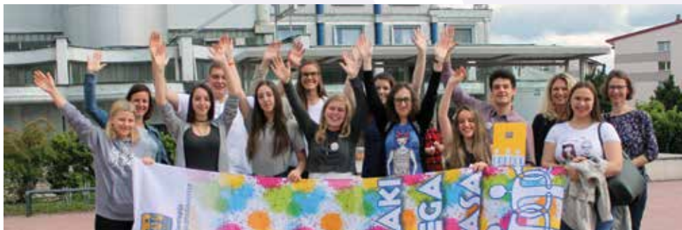
Prostovoljstvo na BIC Ljubljana

Ob letošnjem tednu prostovoljstva je Slovenska filantropija 14. 5. 2019 na prireditvi v Črni na Koroškem podelila letošnje nazive s področja prostovoljstva. Mladim jih je izročil premier Marjan Šarec, ki je v nagovoru zbranim prostovoljcem, mentorjem ter predstavnikom občin in drugih ustanov dejal, da bomo prostovoljstvo vedno potrebovali. Dobitnikom iskreno čestitamo. Prostovoljci na BIC Ljubljana in njihovi mentorji so vsako leto bolj aktivni, tako je letos na vseh enotah 150 dijakov in študentov opravilo skupaj kar 2565 prostovoljskih ur, kar je 1191 več kot v lanskem šolskem letu. Vsem prostovoljcem in mentorjem se zahvaljujemo za njihov pomemben prispevek k izboljšanja dobroti posameznikov, skupin in skupnosti.